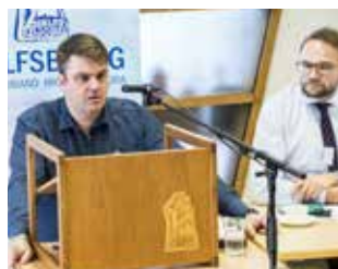
Formaður og fundarstjóri.