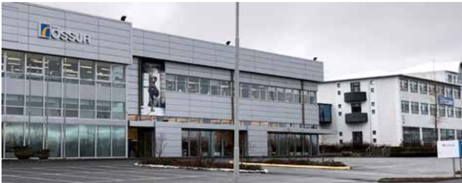
Höfuðstöðvar Össurar hf. hafa aðeins stækkað frá upphafinu í Hátúninu

Við þetta má bæta að umrætt húsnæði sem Össur hf. byrjaði í er húsnæðið sem Halaleikhópurinn hefur verið með til afnota undanfarin ár. Össur hf. hóf síðan formlega starfsemi 1. október 1971.