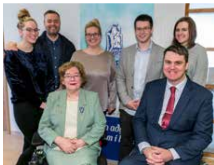
Við afhendingu á Heiðursmerki Sjálfsbjargar lsh á Landsfundum 2017, ásamt fjölskyldu og formanni Sjálfsbjargar.