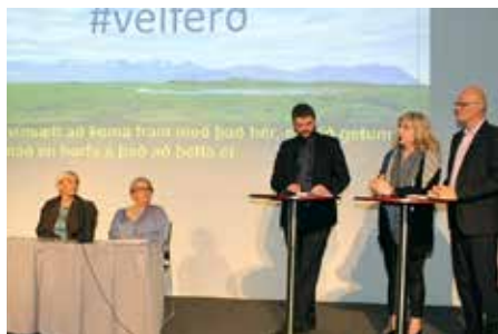
Ráðherrann og annað mektarfólk í panel.