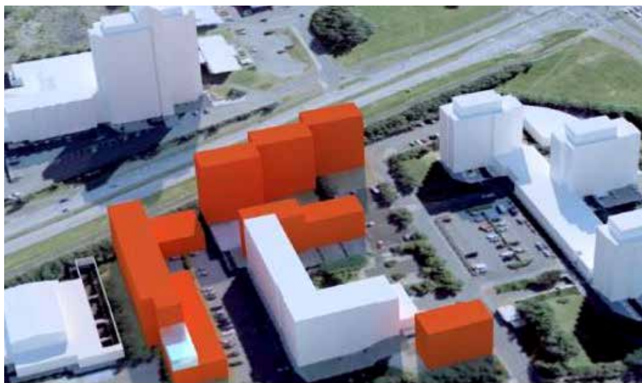
Fyrirhuguð uppbygging við Hátún 12.

Til að fjármagna landsmiðstöðina er fyrirhugað að selja Sjálfsbjargarhúsið, en þar verða væntanlega innréttaðar íbúðir, og jafnframt verður byggður fjöldi íbúða á lóðinni og stefnt er að því að stór hluti þeirra verði seldur. Um er að ræða litlar og millistórar íbúðir með góðu aðgengi, en eftir sem áður