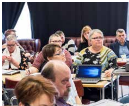
Fulltrúar úr Sjálfsbjörg á höfuðborgarsvæðinu.