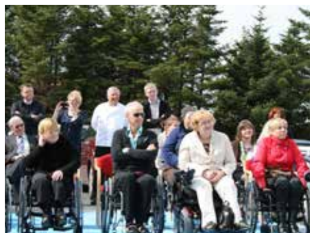
Frá opnun þekkingarmiðstöðvar Sjálfsbjargar 2012.