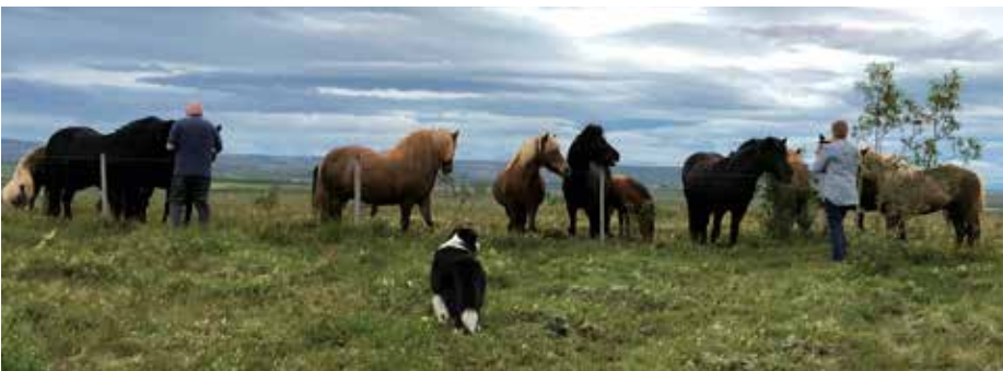
Hestar koma gjarnan að girðingunni sunnan við húsið.

eru hvattir til að senda inn óskir um leigu, en húsið er leigt út viku í senn mánuðina maí til september en um helgar yfir tímabilið október til apríl (og unnt að bæta virkum dögum við á þeim tíma). Upplýsingar um húsið og myndir má finna á vefsíðu Sjálfsbjargar og þar er einnig umsóknarblað sem þarf að fylla út og senda. Skilyrði er að leigutaki sé Sjálfsbjargarfélagi og hafi greitt félagsgjald árið áður (þ.e. ef leigja á árið 2019 þarf félagsgjaldið að hafa verið greitt 2018). Fyrstur kemur fyrstur fær og ekki er tekinn frá tími – aðeins er leiga staðfest með greiðslu leigugjalds.