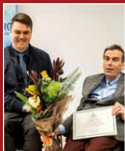
Frá Landsfundi Sjálfsbjargar