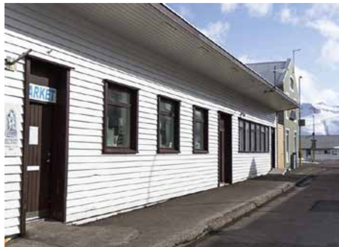
Félagsheimili Sjálfsbjargar Siglufirði.