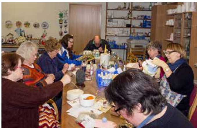
Unnið af kappi á Vinnustofu Sjálfsbjargar Siglufirði.