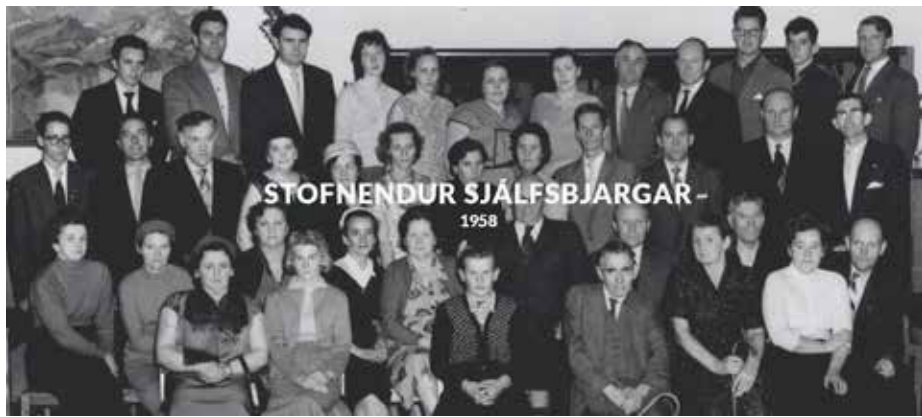
Stofnfundur Sjálfsbjargar, Akureyri 8.10. 1958.

Bragginn sf, bílaverkstæði, Flötum 20 Hamarskóli Ísfélag Vestmannaeyja hf, Tangagötu 1 Ós ehf, Illugagötu 44 Rannsóknarþjónustan V.M., Ægisgötu 2 Vinnslustöðin hf, Hafnargötu 2