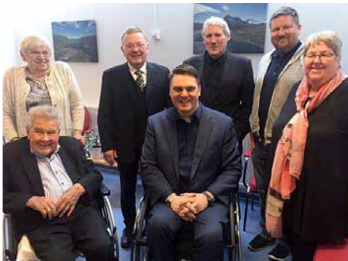
Hefðarfólk í afmælisboðinu á Ísafirði.