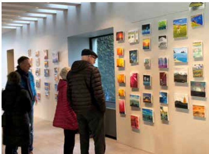
Gestir á sýningunni skoða verkin.